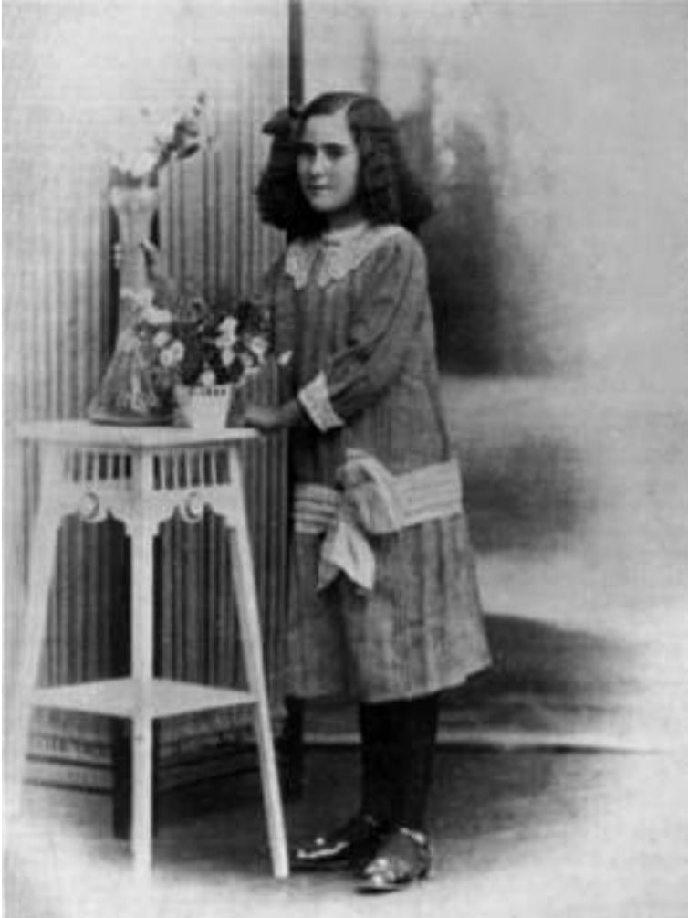
Federica Montseny Mañé d'adolescent (Urales 2020, p. 486).

cions, i es va fer evident així la notorietat pública de la parella. Per exemple, El País se'n feia ressò i els felicitava de manera entusiasta: «Nuestra estimadísima amiga, la notable escritora