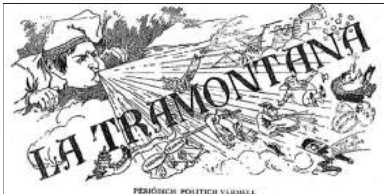
Capçalera de La Tramontana, 1888.