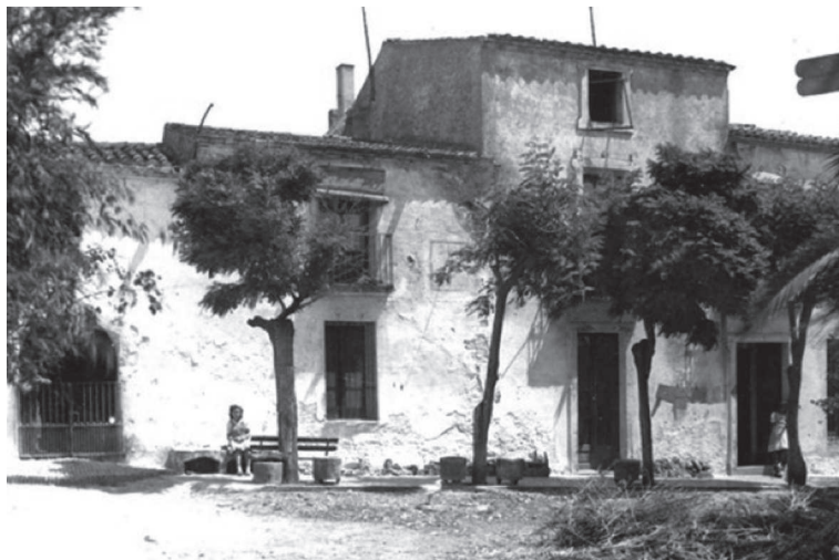
Can Bayell.

les obres que s'estrenaven als teatres barcelonins com el teatre Apolo o l'Español.