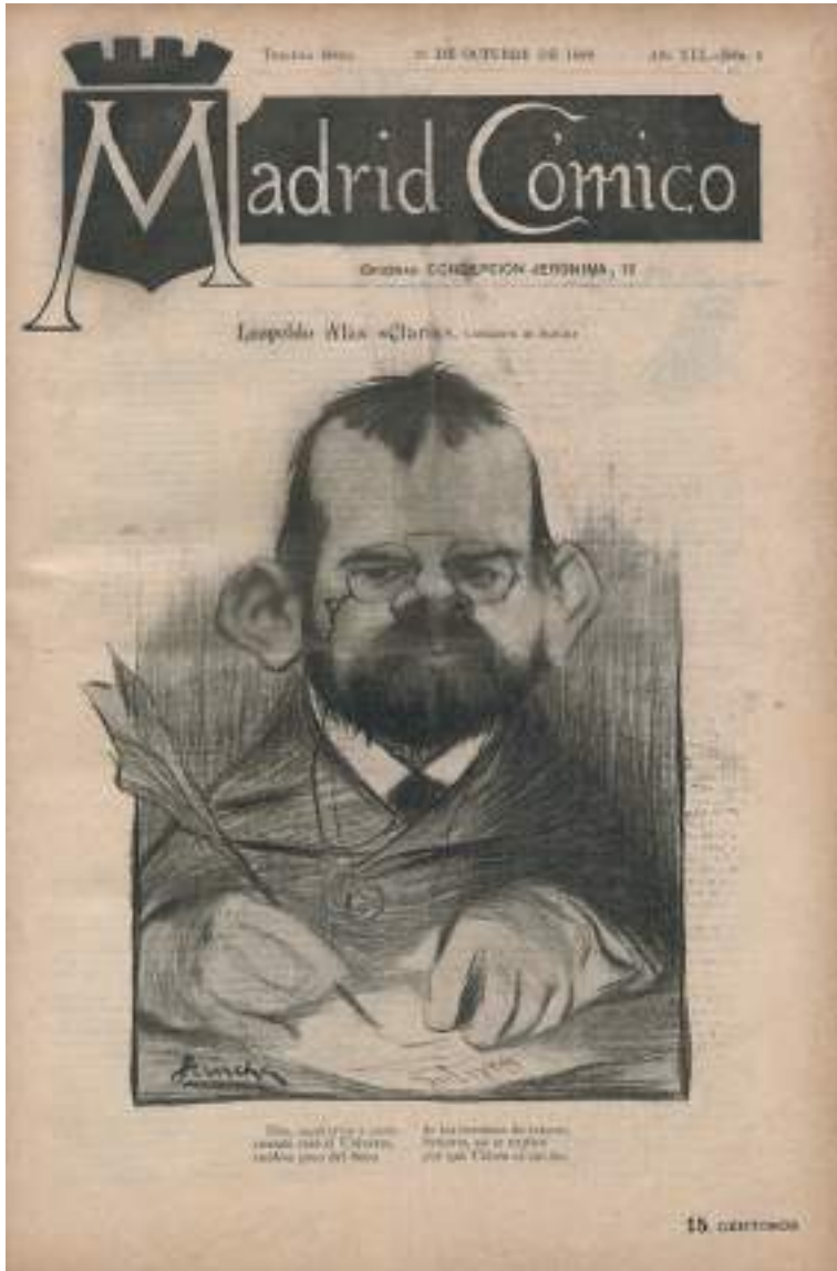
Clarín a la portada del Madrid Cómico, 28-10-1899, 4.